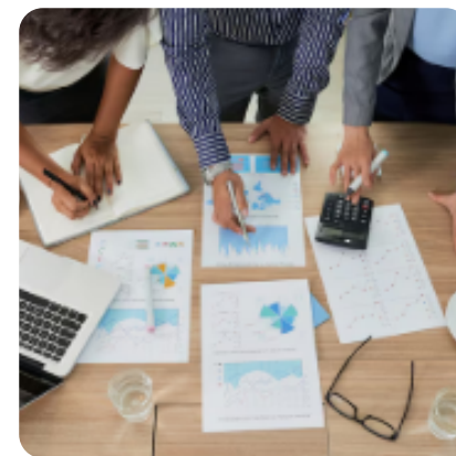
Imagen y Sonido